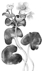
Д. Калужница болотная.

18. (5 балла) Где происходит самое активное испарение (при одинаковых прочих условиях)?