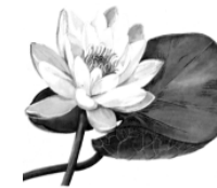
Б. Кувшинка белая.