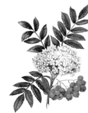
А. Рябина обыкновенная.

17. (5 баллов) Нимфы, божества природы, в греческой мифологии имели вид прекрасных дев. В каком водном растении Карл Линней увидел „божество” и дал ему латинское название – «нимфея»?