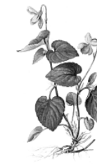
В. Фиалка Ривиниуса.