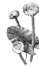
Г. Кубышка желтая.